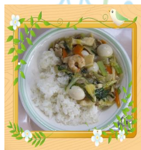
中華丼 (さいたま市)