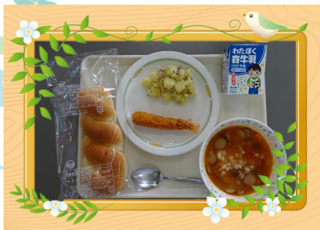
もち麦のミネストローネ (行田市)