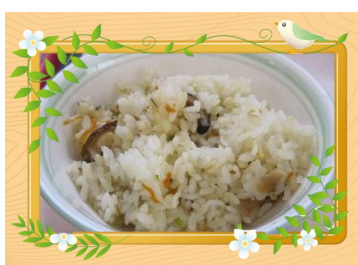
じゅうしい (さいたま市)