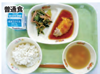
調理ばさみを使用し、一口大～粗みじんに刻む等、対応します。

肢体部門においては、「普通食」「きざみ食（大）」「きざみ食（小）」「ペースト食」の四形態を提供しています。主食は、米・パン・麺をそれぞれ