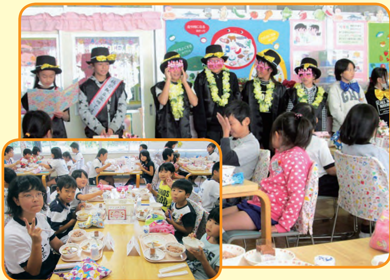
ハッピーランチ 春日部市立内牧小学校