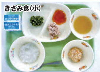
ペースト食と混ぜ合わせて食べる等、個別の対応をします。