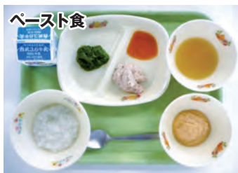
さらにミキサーにかけたり、裏ごししたりします。

粥にして提供しますが、出来上がり状態から、白飯とお粥を混ぜ合わせたり、お粥をミキサーにかけたりと、個別の対応を必要とします。麺粥についても、当日の麺の種類により茹で時間が変わったり、味付けが変わったりします。