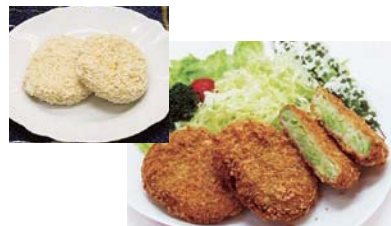
(有)オカダ食品 50g 42円/60g 50円

北海道の中札内産のむき枝豆を約40%と北海道産のジャガイモを使用しています。緑の色が鮮やかで、枝豆の食感と風味が生きた食べ応えのあるコロッケです。