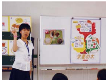
【伊奈町立小室小学校】