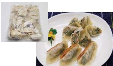
(有)オカダ食品 20g 20円

埼玉県北部で古くから作られている野菜の「しゃくし菜」を使用しました。しゃきしゃきとした歯ごたえが特徴の餃子です。