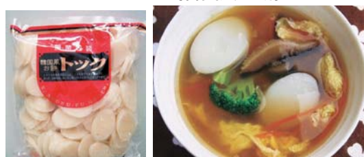
(株)大槻食品 1kg 960円

韓国の伝統的食材の「トック」を国産米で製品化しました。野菜スープ、キムチ鍋、お汁粉などのメニューに御利用ください。薄くスライスしていますので火の通りが早く、調理後煮崩れせず、時間が経過しても硬くなりにくい加工にしています。