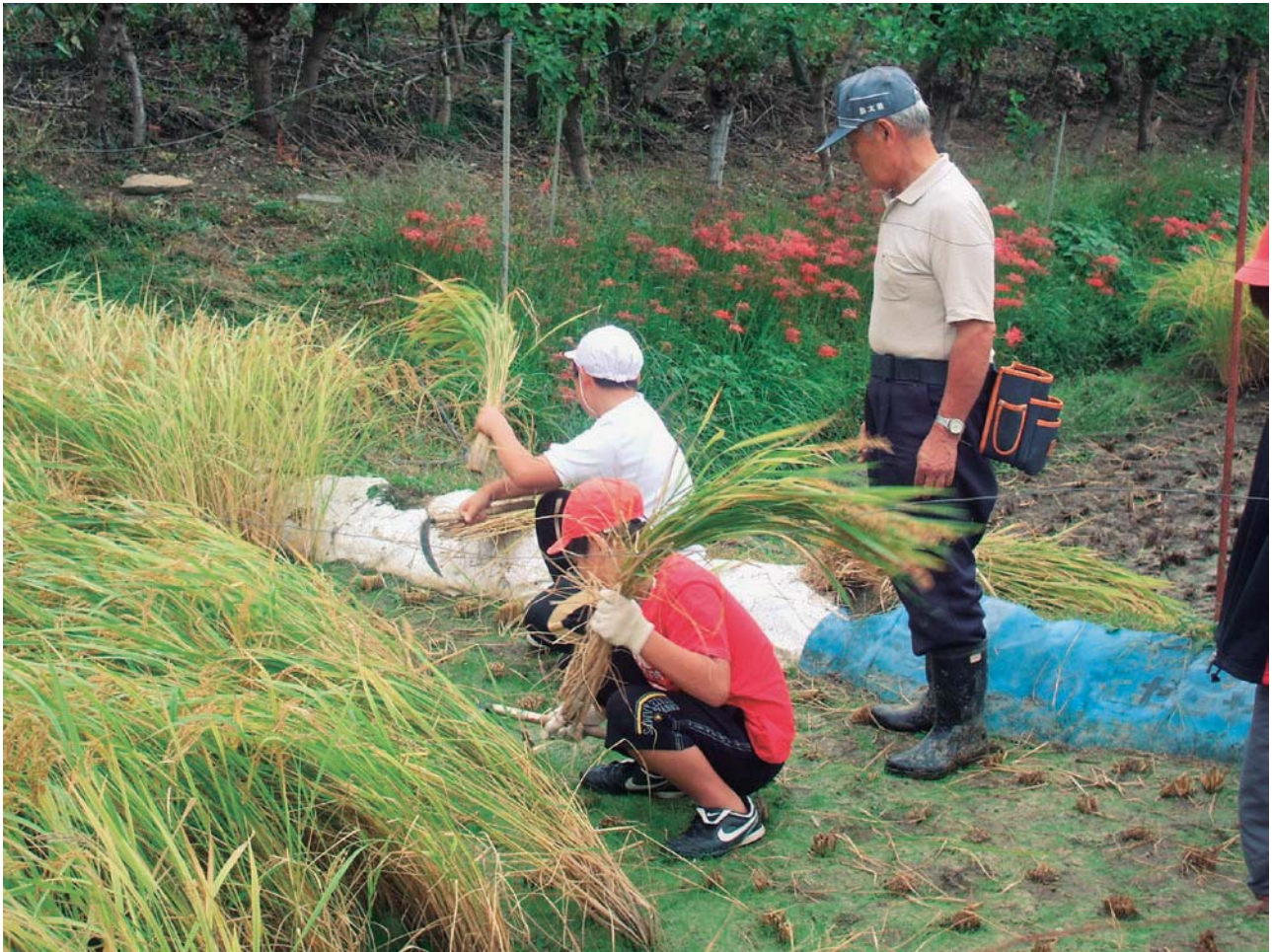
稲刈り風景 (長瀬町立長瀬第二小学校)

編集・発行 〒364-0011 北本市朝日2丁目288番地 (財)埼玉県学校給食会 TEL 048-592-2115 FAX 048-592-2496 http://www.saigaku.or.jp