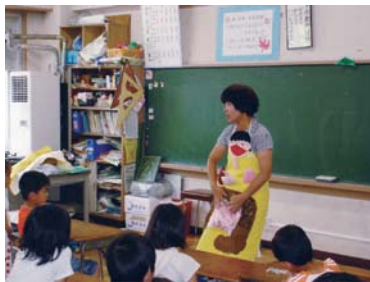
【鳩ヶ谷市立中居小学校】