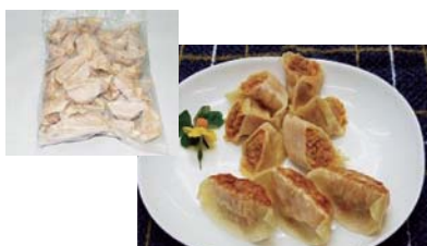
(有)オカダ食品 20g 23円

埼玉県産の白菜で作った、無添加のキムチを使用した餃子です。ピリッとした辛さが食欲をそそります。